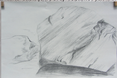
Kristýna Zedníčková, 18 let, kresba

i emočních vlastností. Ostatně je základem příjmu do první třídy základní školy. Výtvarná kresba je studijní, volná a má různé alternativy. Rozvíjí propojení pravé a levé mozkové hemisféry, umocňuje všímavost a uvědomění si toho, co vidíme. Základní kresba je lineární nebo plastická, může být i barevná.