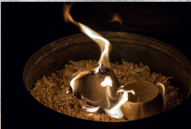
Jan Pňáček, 18 let, výpal raku keramiky, foto z absolventské práce

Grafikou obesíláme rádi soutěže, i nám zůstává originál. Fotografie je velmi blízké a osobité médium vhodné pro jakýkoliv věk. Úspěšná jsou taková foto, která jsou technicky v pořádku, tj. zaostřená, se správným světlem a kompozicí a nesou osobitý pohled na svět svého autora. Současně oslovují diváka.